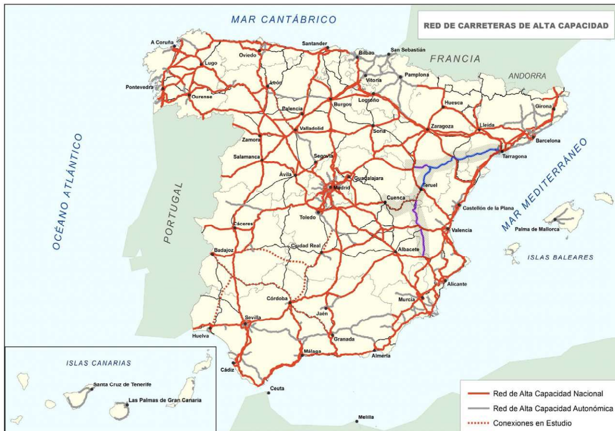
Figura 3. Red de carreteras de alta capacidad con la inclusión del «Arco Mediterráneo Interior», cuyos tramos de autovía nueva van en azul y morado

El Arco Mediterráneo interior es un verdadero eje vertebrador en diferentes escalas.