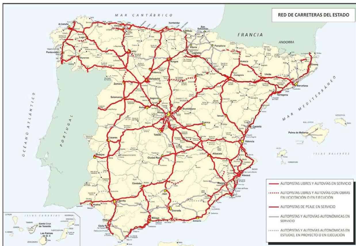
Figura 1. Plano actual de autovías y autopistas

Una ordenación de este espacio geográfico que parte de tres problemas. En primer lugar las deficiencias de la red arterial de autovías para vertebrar los territorios del Sistema Ibérico y del sector oriental de la Submeseta Sur, así como la necesidad de disponer en este sector de ejes, con disposición norte sur, para mallar la red de autovías existente, multiplicar su eficacia y distribuir mejor los tráficos ordinarios y en momentos puntuales.