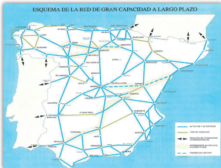
Fuente: Plan Director de Infraestructuras 1993-2007, Ministerio de Obras Públicas y Transportes, 1993.

Ninguno de estos dos ejes carreteros es exclusivo para la provincia de Teruel ni su viabilidad depende de los tráficos que aporte Teruel; son ejes de importancia estatal, que favorecen el desarrollo de muchas provincias y Comunidades Autónomas, que vertebran y cohesionan el territorio español , mallando la red de comunicaciones carreteras de alta capacidad, a la que aportan mucha mayor eficiencia, dotando simultáneamente de las infraestructuras necesarias a uno de los territorios con mayor despoblación de España y eliminando un amplísimo vacío territorial que ha dejado la construcción de las redes de alta capacidad en España.